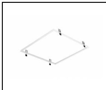
Rahmenadapter Gipskartondecke 630x630 weiß (Stahlversion) (999543)

Erstellungsdatum der Karte: 25 Januar 2024