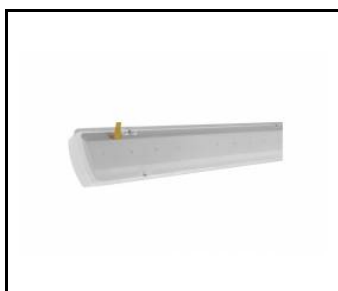
TYTAN LED 1150mm 2500lm 840 - moduł świetlny (2018.09) (909016)