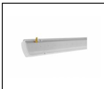
TYTAN LED 1150mm 2300lm 830 - moduł świetlny (2018.09) (909009)