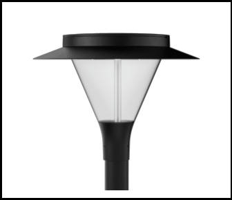
SKVER auvent. modèle 1 RAL9005 (435522)