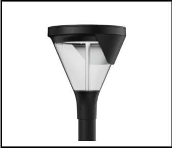
SKVER Backshield RAL9005 (435515)