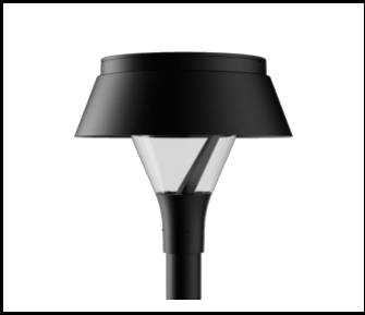
SKVER auvent ULR modèle 2 RAL9005 (421518)