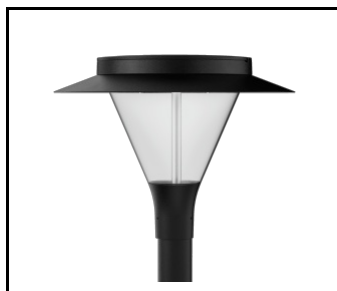
SKVER Hood příklad 1 RAL9005 (435522)