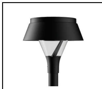
SKVER Hood ULR příklad 2 RAL9005 (421518)