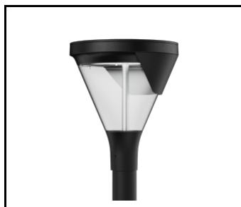
SKVER Backshield RAL9005 (435515)