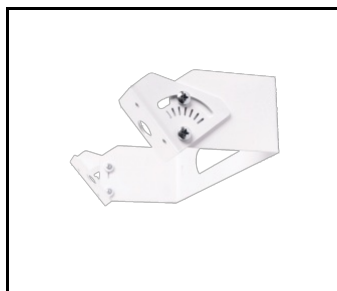
Úhlová montážní sada 0-90 ORION (897184)