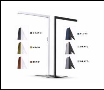
Gitter -PET Baris Stand GRAYL (744822)