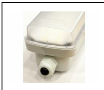
Zaslepovací zátka M16 různá PA černá - BPM-21 (60000006)