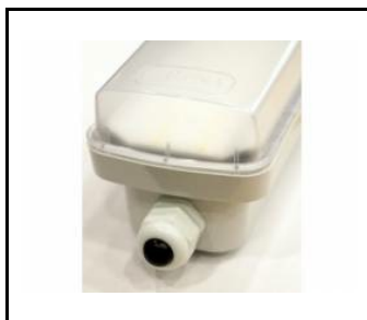
Zaślepka dławnicy M16 różne PA czarna M-16 - BPM-21 (60000006)