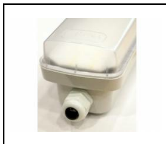
Zaślepka dławnicy M16 różne PA czarna M-16 - BPM-21 (60000006)