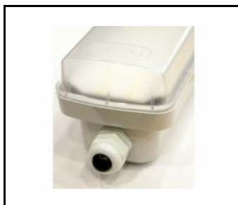
Zaślepka dławnicy M16 różne PA czarna M-16 - BPM-21 (60000006)