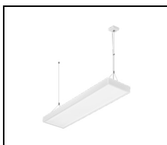
CONTRA Système de suspension LED 1200x300 (374692)