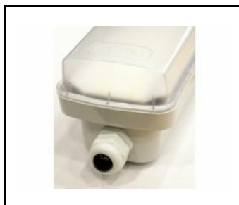
Zaslepovací zátka M16 různá PA černá - BPM-21 (60000006)