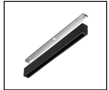
Terrano povrchový rám černý mat RAL9005 573x38x60 (420948)