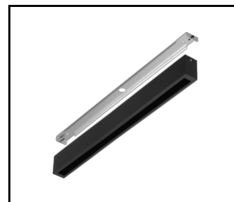
Terrano povrchový rám černý mat RAL9005 573x38x60 (420948)