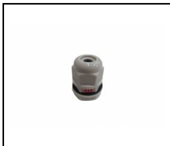
Variabilní odvodušňovací vývodka šedá M20*1,5 IP68 (16000507)