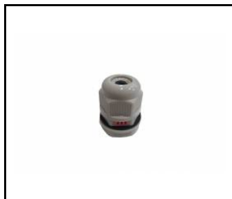
Variabilní odvodušňovací vývodka šedá M20*1,5 IP68 (16000507)