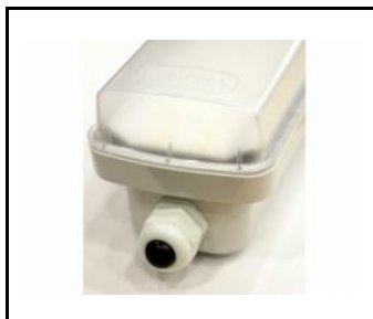
Zaslepovací zátka M16 různá PA černá - BPM-21 (60000006)