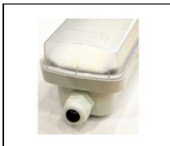
Zaslepovací zátka M16 různá PA černá - BPM-21 (60000006)