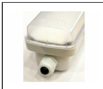
Zaslepovací zátka M16 různá PA černá - BPM-21 (60000006)