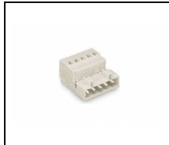
ELEGANTE SYSTEM LED 3pólová zástrčka (388767)