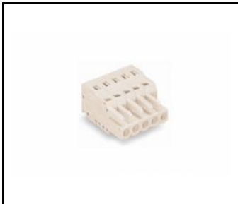
ELEGANTE SYSTEM LED zásuvka 3 póly (388743)