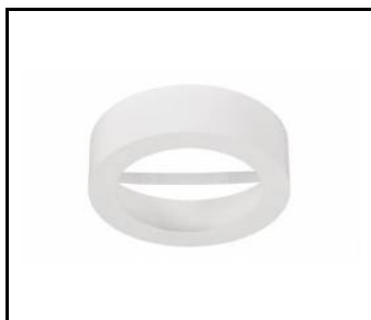
KULATÉ POUZDRO FRAGA 6W/11W. NECTRA 5W/7W IP44 (059841)