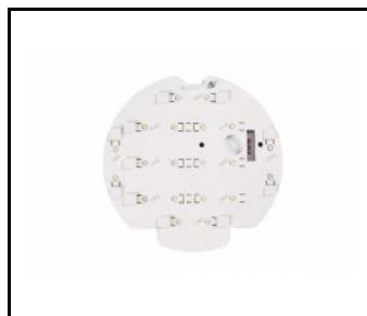
CORAL- 10W servisní sada 10W RCR 3000K (229848)