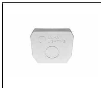
LINEA S LED zakończenie IP40 (980060)