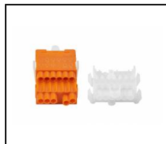
LINEA S LED zestaw zasilający 11P (981388)