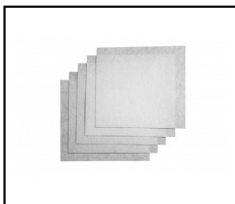
Filtr HEPA H10 - komplet 5 szt. tylko do modelu Flow (243677)