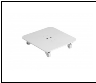
Aksesoryjny zestaw kótek SterilOn Flow 144W biały mat (243660)