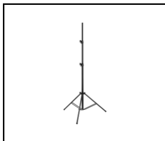
Stahlstativ 3 m (000294)

Erstellungsdatum der Karte: 21 November 2023