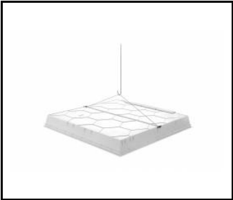
COMPACT LED EVO Protection de montage (plafond modulaire) / Suspension de sécurité (plafond modulaire) (904349)