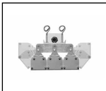
INDUSTRY IP66 LED MR 2