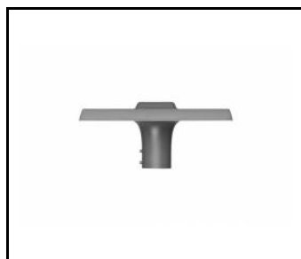
MITRA LED - 0