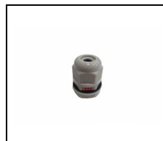
Divers presse-étoupe gris M20 * 1.5 IP68 (16000507)