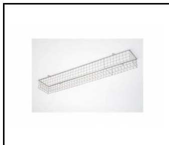
TYTAN - grille de protection 1152mm (907913)