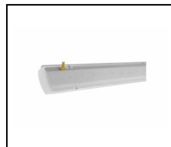
ATLAS LED 1450mm 7020lm 840 MAT - module d'éclairage (657429)