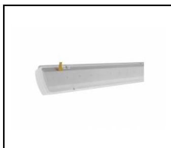
ATLAS LED 1450mm 7020lm 840 MAT - module d'éclairage (952074)