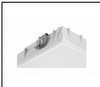
COMPACT LED EVO P ZK UCHWYT MONTAŻOWY