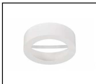
BOITIER ROND FRAGA 6W / 11W, NECTRA 5W / 7W / 7W IP44 (059841)