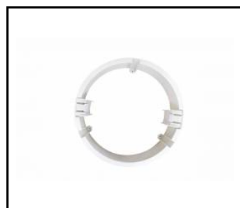
BOITIER PC DE SURFACE NECTRA LED IP44 20W / 25W (059995)