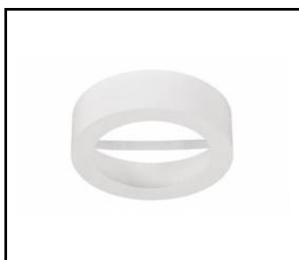
NECTRA 18W - BOITIER À SURFACE RONDE - BLANC (059759)