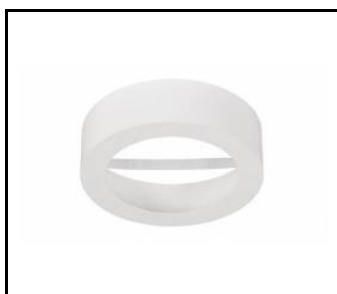
BOITIER ROND FRAGA 6W / 11W, NECTRA 5W / 7W / 7W IP44 (059841)