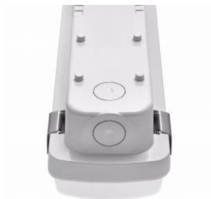
wybór miejsca zasilania / choosing a place of power supply / Stromversorgungsanschluss von mehreren Seite möglich