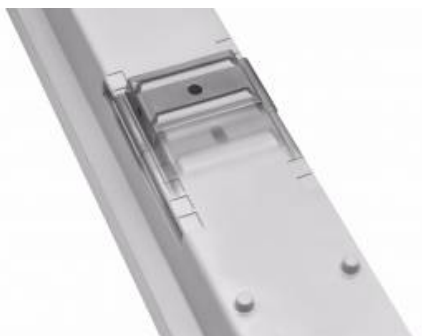
regulowane uchwyty / adjustable handles / einstellbare Halterungen