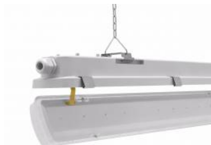
system zwieszania klosza / suspension system of the diffuser / hängende Diffusor