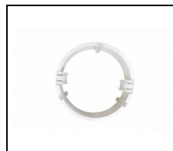
NECTRA LED IP44 20W/25W OBUDOWA NATYNKOWA PC (ø220/70) (059995)