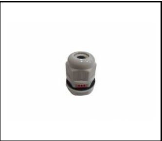
Drüse Entlüftung verschiedene grau M20*1.5 IP68 (16000507)