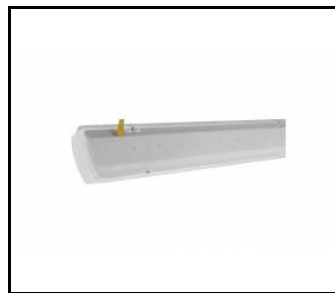
TYTAN LED HALL 1450mm 9200lm 830 - Lichtmodul (907739)