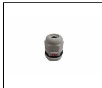
Drüse Entlüftung verschiedene grau M20*1,5 IP68 (16000507)

Erstellungsdatum der Karte: 11 marzec 2021