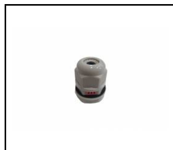
Drüse Entlüftung verschiedene grau M20*1,5 IP68 (16000507)

Erstellungsdatum der Karte: 11 marzec 2021