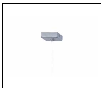
ZAWIEŚ POJEDYNCZY NOŚNY (puszka kwadratowa) (171642)