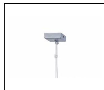
ZAWIEŚ POJEDYNCZY ZASILAJĄCY (puszka kwadratowa) (171574)