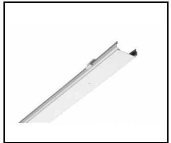
LINEA S LED - PVC Abdeckung 1764mm (981159)