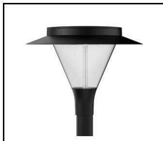
SKVER Daszek wzór 1 RAL9005 (435522)