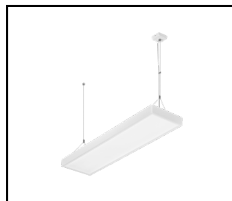
CONTRA LED závěsný systém 1200x300 (374692)