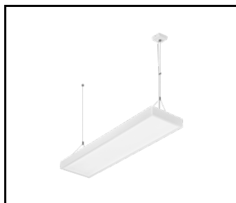
CONTRA Système de suspension LED 1200x300 (374692)

Date de création de la carte: 12 janvier 2024