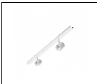
LINEA S LED 1176mm - 2xEXPO ADJUST 2050lm zoom 22-55st. WEISS 840 20W (981289)