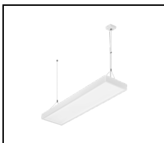
CONTRA LED system zwieszania 1200x300 (374692)