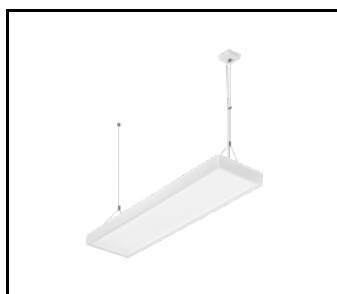
CONTRA LED system zwieszania 1200x300 (374692)