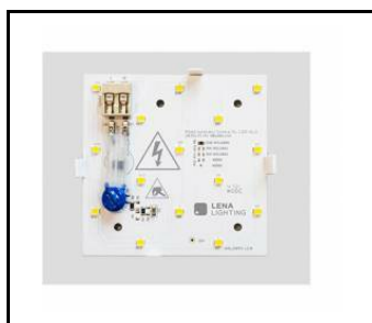
Gamma LED Basic 280 1000lm 840 (10W) - světelný modul (754951)