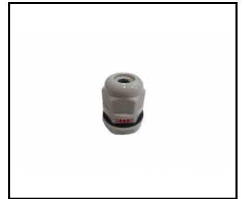
Drüse Entlüftung verschiedene grau M20*1.5 IP68 (16000507)