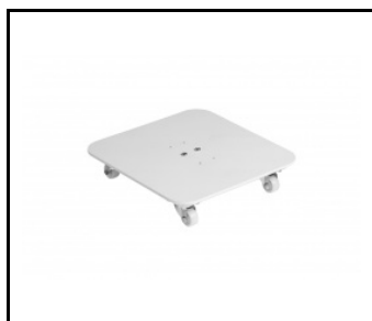
Jeu de roues de guidage Sterilon Flow 72W blanc mat (243646)