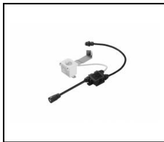
OCULUS LED- czujnik ruchu (967047)