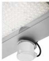
QUEST PLUS LED HB RCR