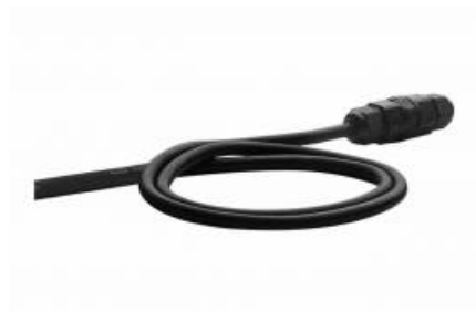
przewód / cable H07RN-F 0,7m