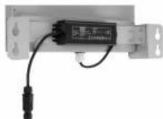
quest plus led hb endura nt