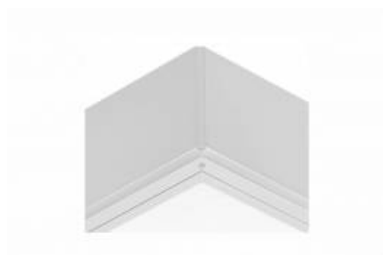
COMPACT LED EVO N IP65