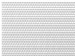
COMPACT LED EVO PRM