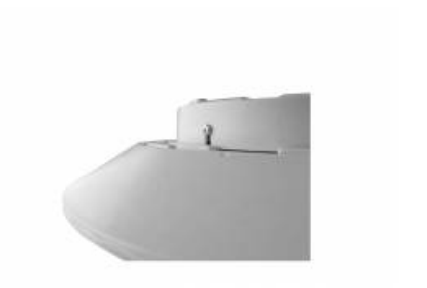
CAPELLA LED BOX ANTYWANDAL