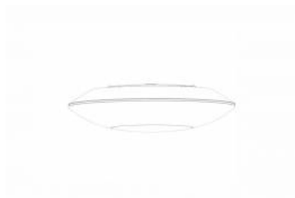
CAPELLA LED EDGE