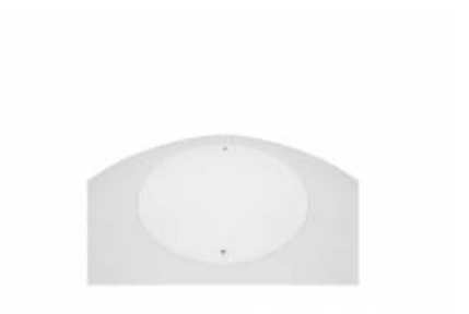
CAPELLA LED EDGE ANTYWANDAL